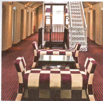
Malmaison Oxford Castle