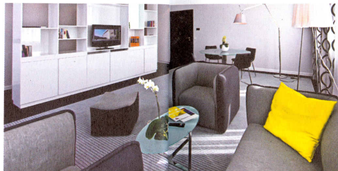
Anel's Hotel Berlin